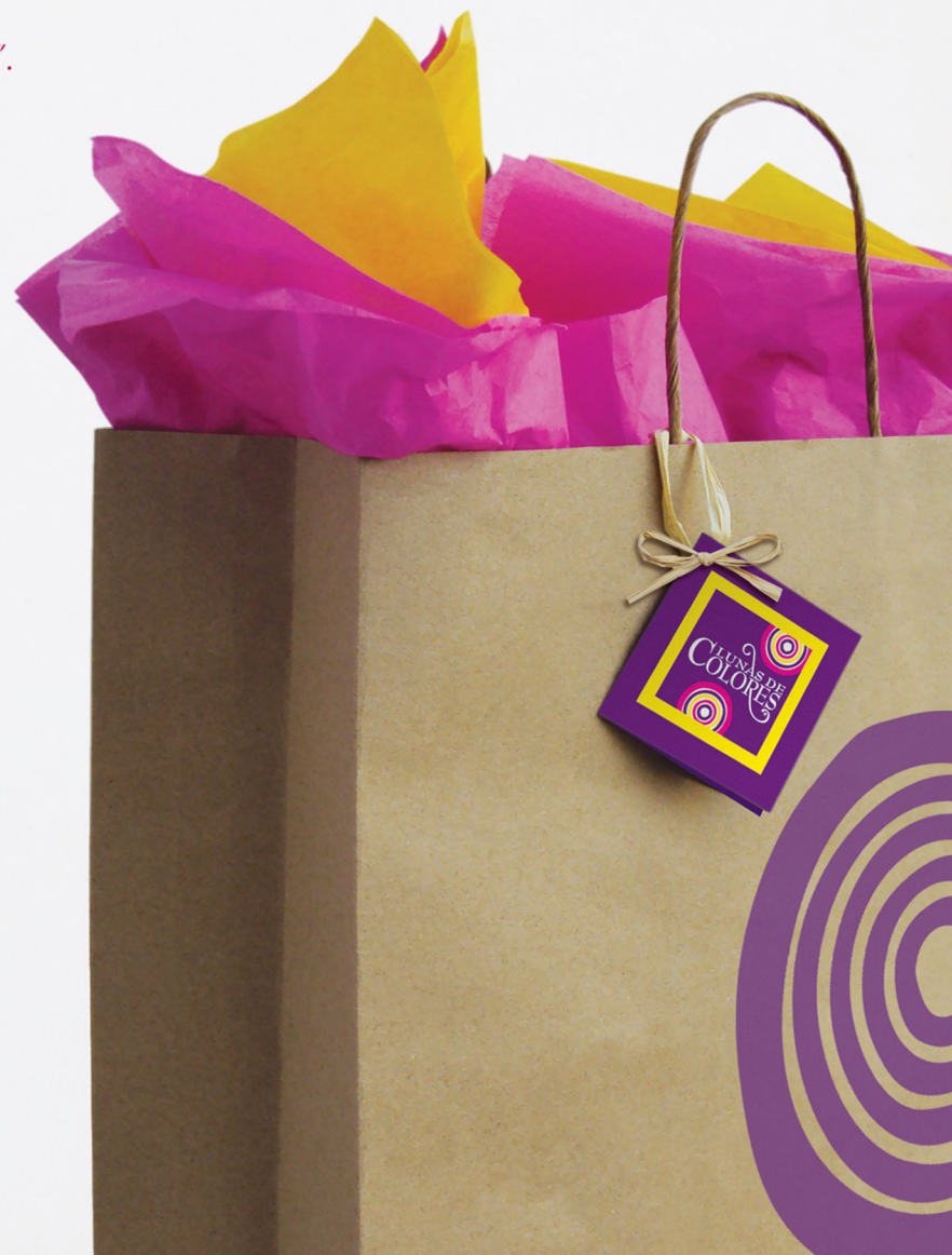
Aplicación de imagen