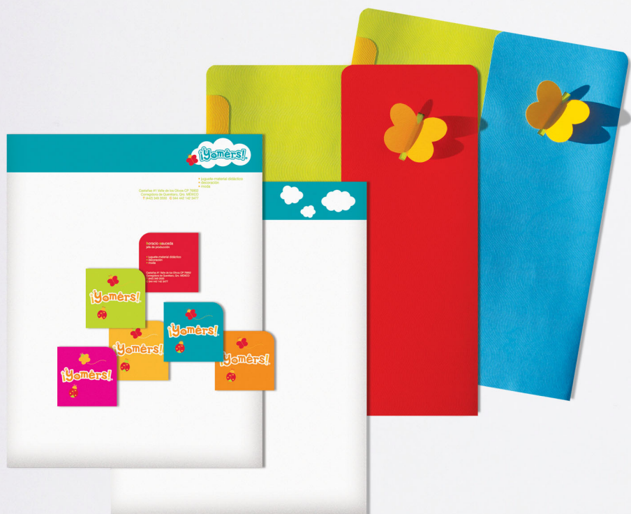
Tarjetas y papelería

"Al crear, busco diseñar marcas divertidas directas al corazón".