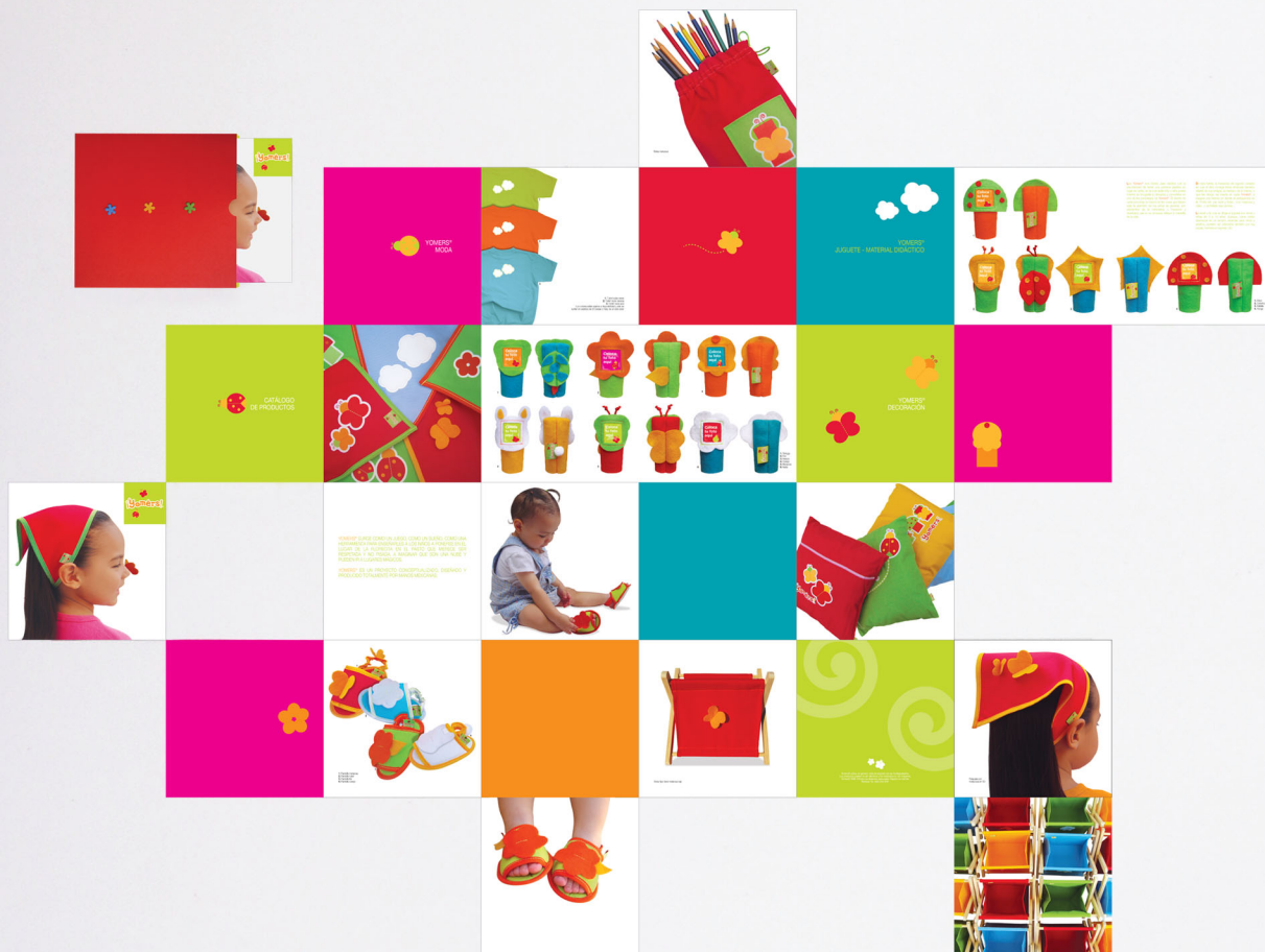
Catálogo de productos