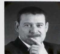
Sabido & Basteris

www.sabidobasteris.com info@sabidobasteris.com